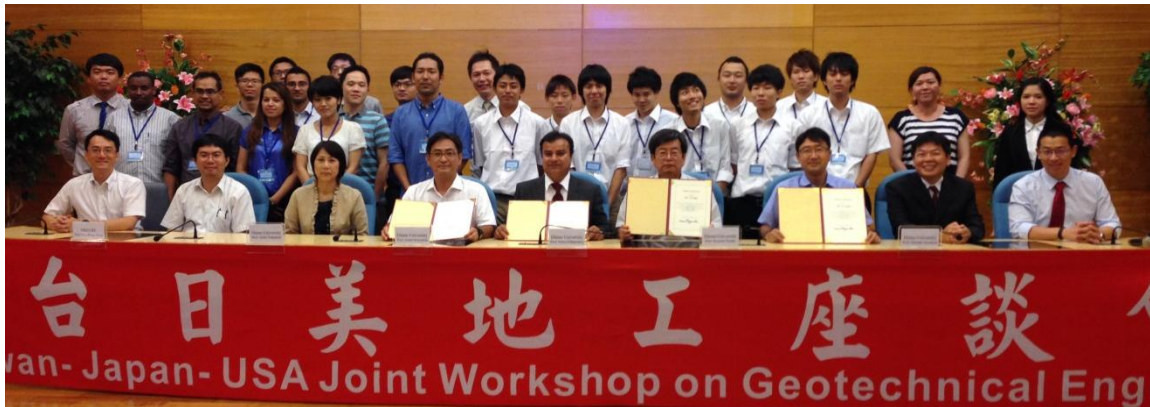
ジョイントワークショップ参加者による記念撮影