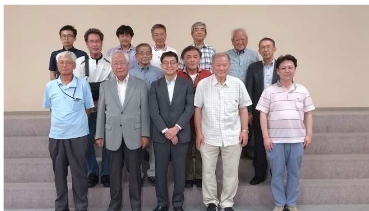
(令和 5 年度中国支部総会開催状況)