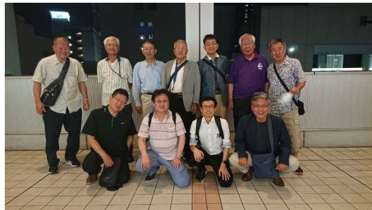
(令和 5 年度役員会開催状況)