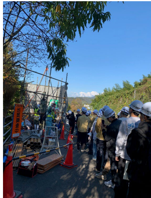
ボーリング掘削の様子を見学