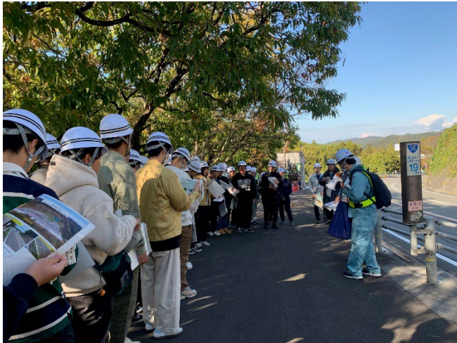
説明を受けている様子