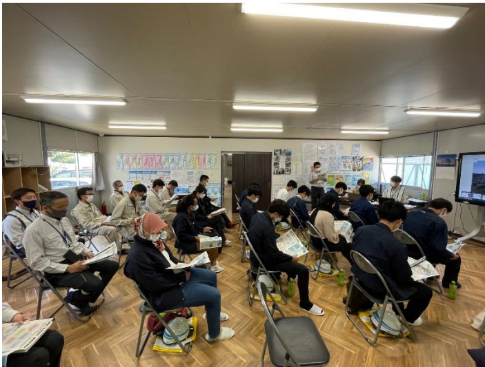
事務所で現場説明を受ける様子（左）