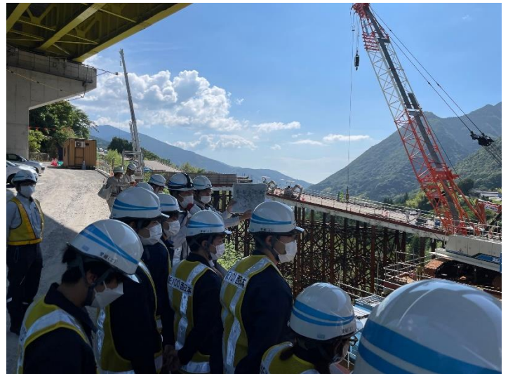
地滑り対策の説明を受ける様子（右）