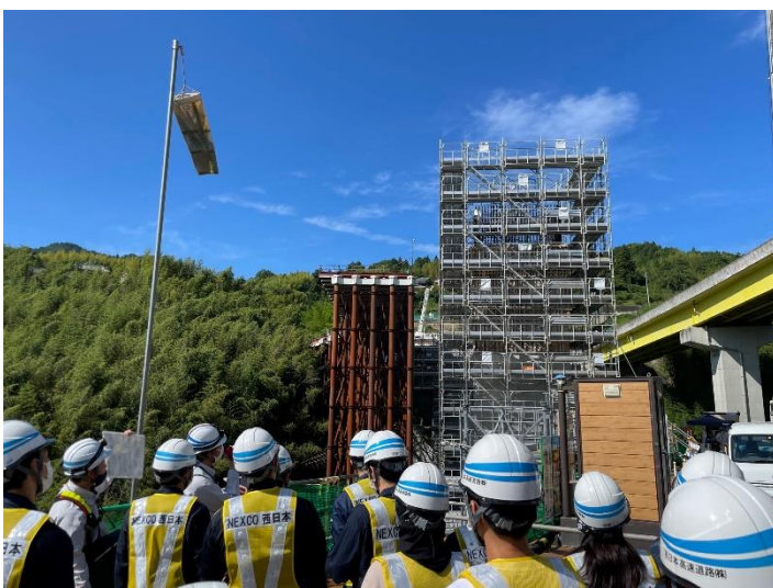
橋脚の打設について説明を受ける様子（左）