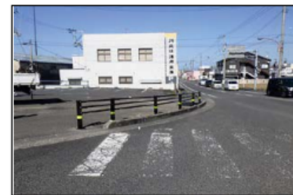
対策イメージ：ガードパイプ