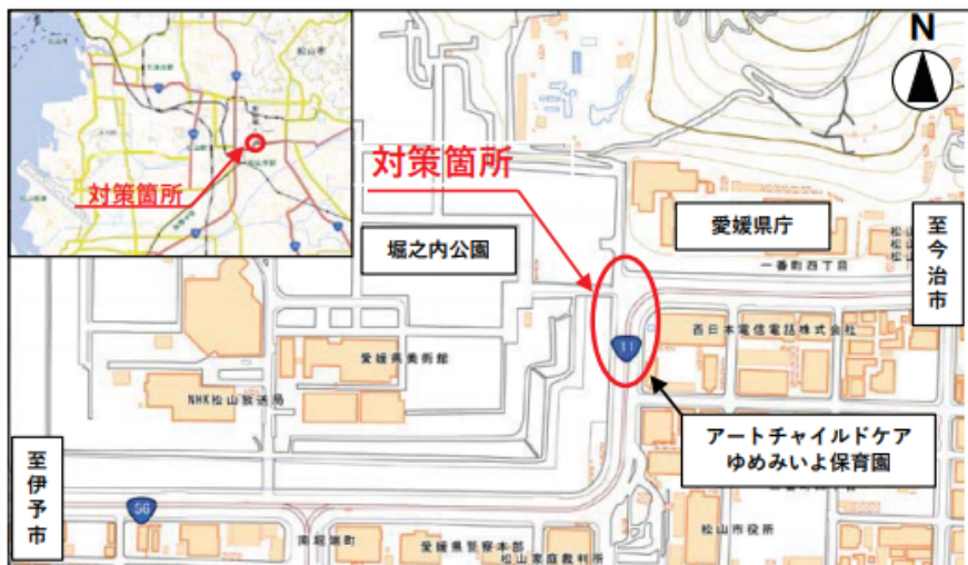
この地図は、国土地理院の地理院地図に加筆したものである。