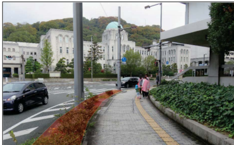
※ 部分に遮蔽物がない。