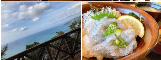
合宿の様子(上)と瀬戸アグリトピアからの風景(左下)、しらす丼(右下)

私たちの合宿の舞台となったのは「瀬戸アグリトピア」。宇和海を見渡せる絶景ロッジでした。 一日目は基本的な四則演算のプログラミングを学びました。しかし、何度コードを作成してもエラーの連続。全角文字の混入やスペルミスなど、些細なミスでプログラムは成立しません。プログラミングの繊細さを痛感し、ようやく完成した頃には日を越えていました。 二日目の最初は、データの抽出や並べ替えを行うプログラムを作成しました。学生各々が作成と修正を何度も繰り返しながら、話し合いながら数時間かけて作成しました。 その後、昼食は近くの「佐田岬」はなはなで海鮮丼やしらす丼といった海の幸を堪能できました。 二日目最後の課題は「オセロの打つ手を考えるプログラム」の作成でした。状況に応じた処理内容の判断が必要になり、難易度がさらに上がったように感じました。 当然ながら、コンピュータには「オセロの打つ手を探索せよ」という命令文は存在しません。普段私たちが行なっている判断