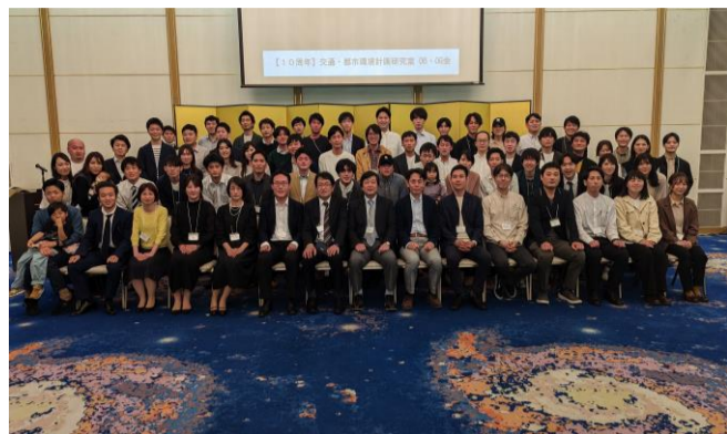
全体での集合写真