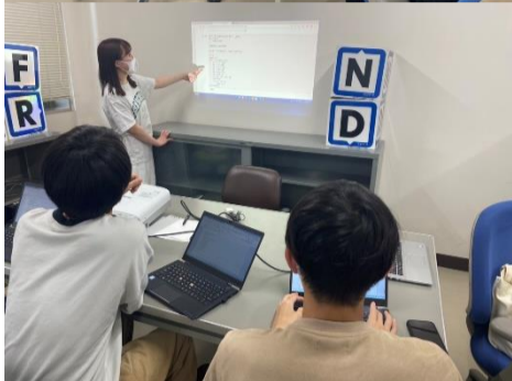
日頃の様子(上)とプログラミングゼミの様子(下)

います。ところで、私たちの中で今流行っているのが、タイピング練習ができるサイト「寿司打」です。初級・中級・上級があるのでですが、最初は初級でもなかなかクリアできませんでした。しかし、毎日続けることで中級