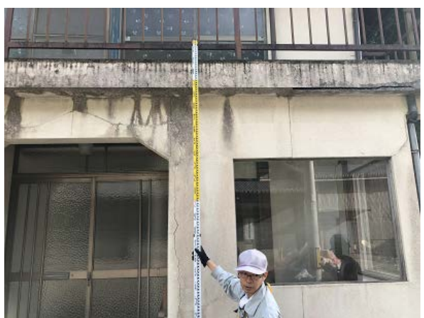
写真⑧(作業場向かい)