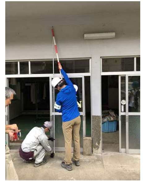
写真⑮(クリーニング店)