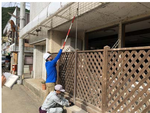
写真④(バス待合所左)