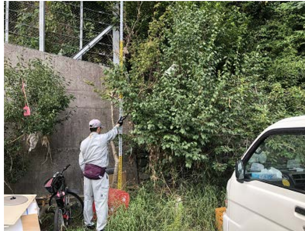
写真⑰(公園、対岸の東端)