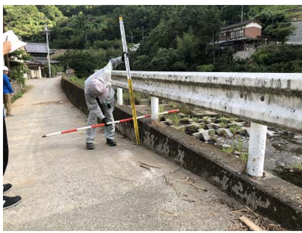
写真⑪(右岸ガードレール)