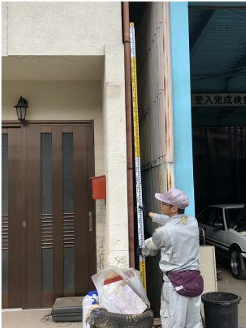
写真⑯(ダイハツ西1軒目)