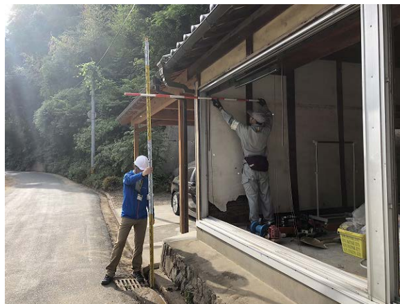
写真②(右岸側西端の家)