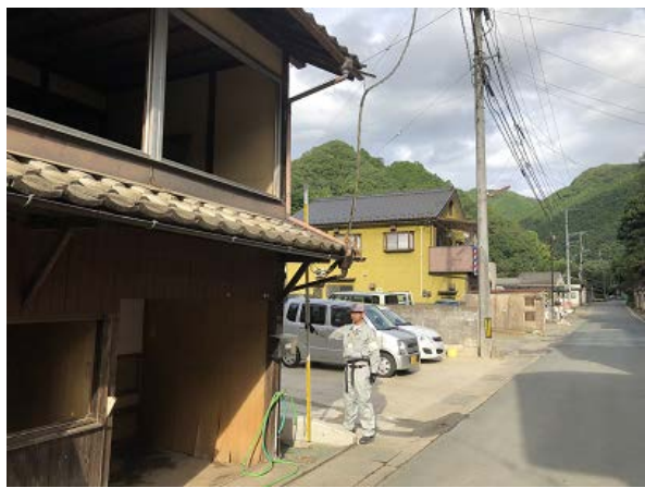
写真⑦(郵便局東3軒目)