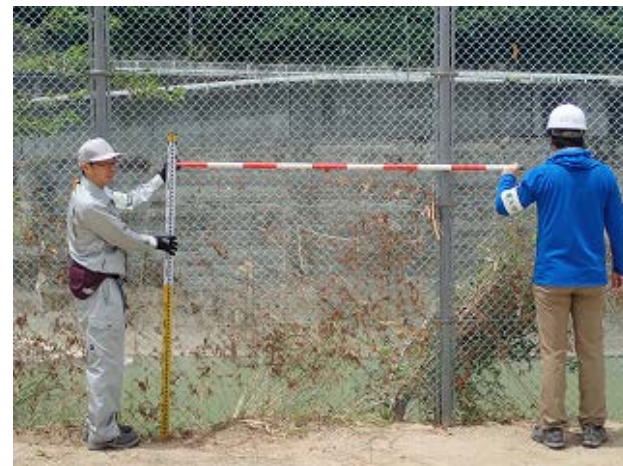
写真㉑(肱川中フェンス)