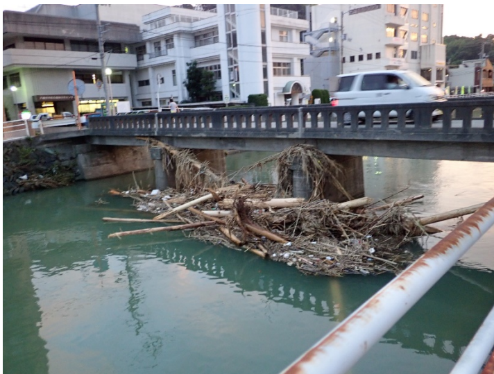
写真08(はまだ橋にかかる流木)