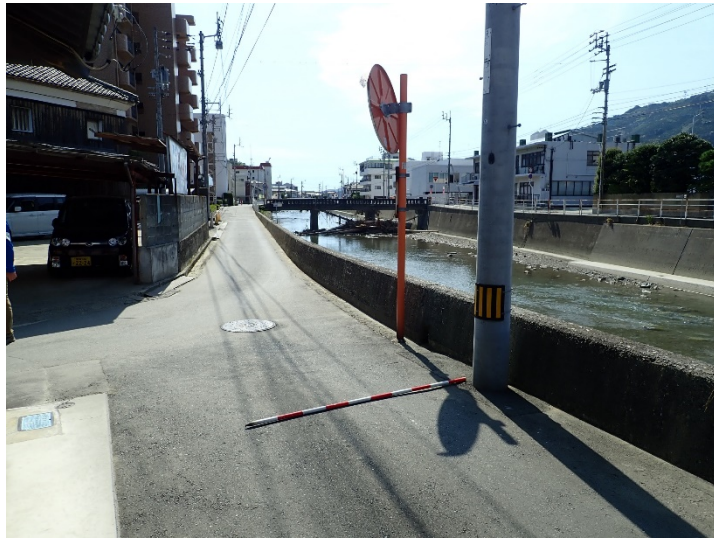
写真01(千丈川左岸、はまだ橋上流)