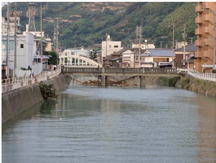
写真07(下流から見たはまだ橋)