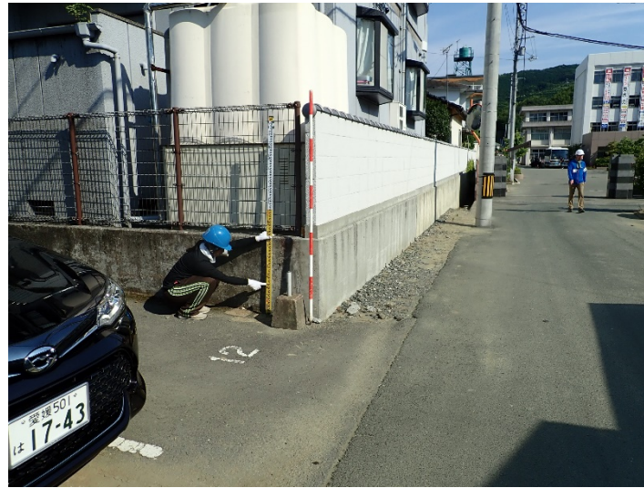
写真05(八幡浜工業高校前)