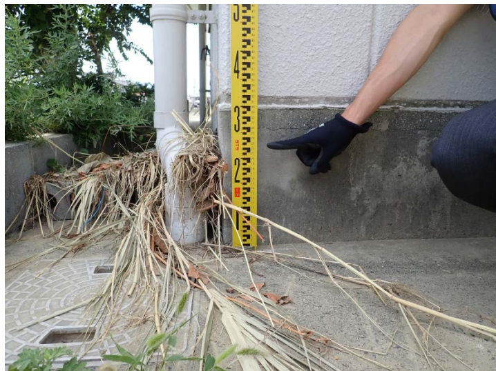
写真01(フジ裏 駐車場)