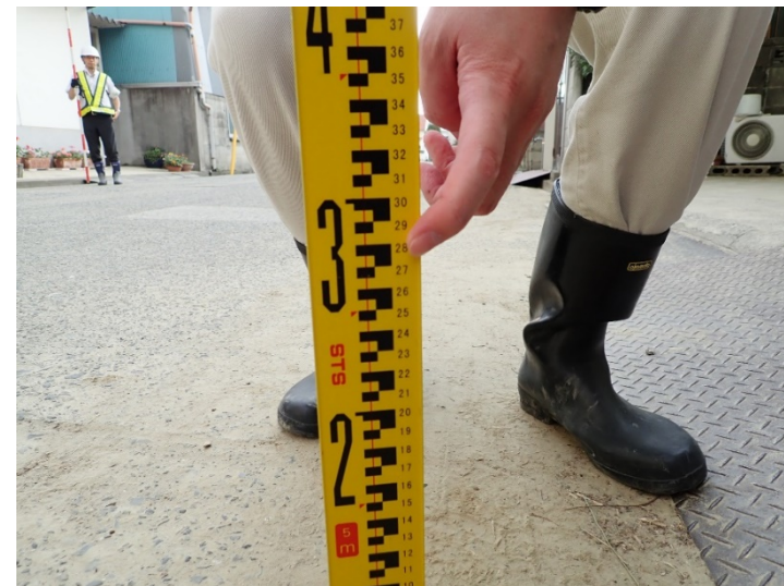
写真03(たたみ店裏の道路)