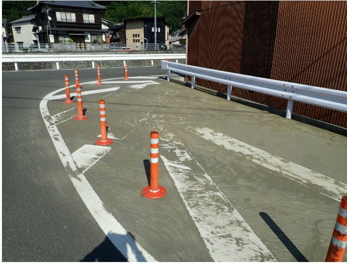
写真01(五反田川、支流合流点)