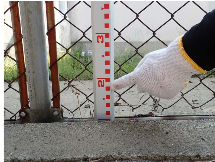
写真02(松陰小学校東のフェンス)