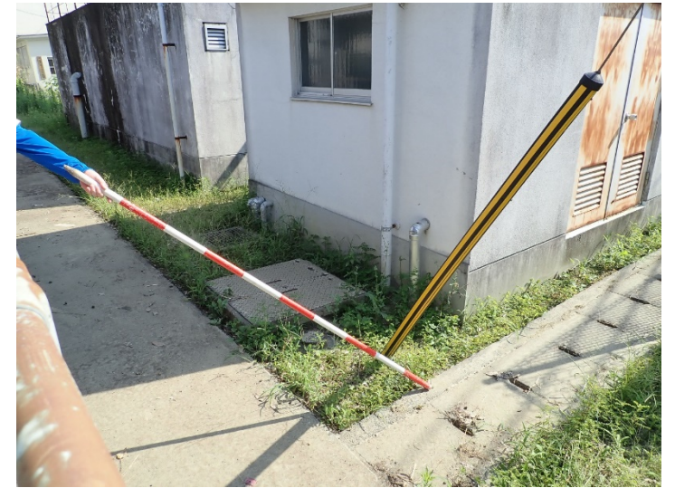
写真03(松陰小学校東部)