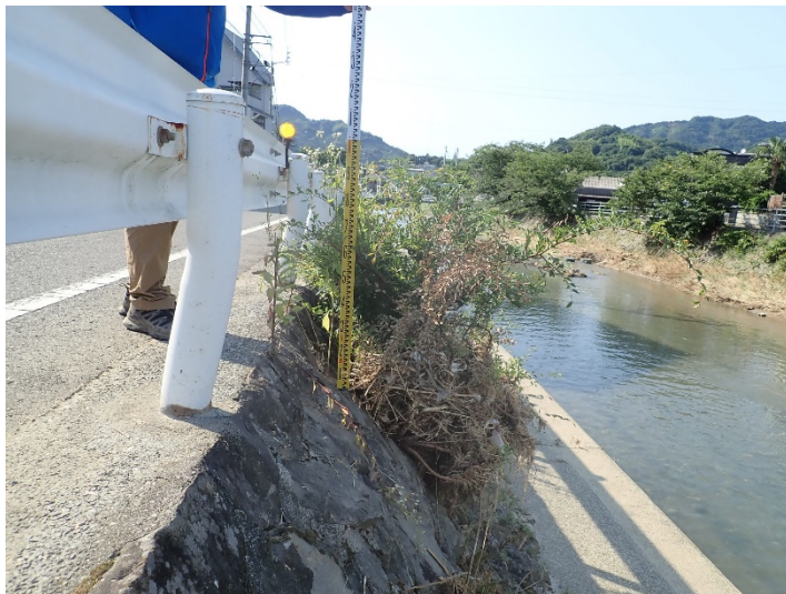
写真04(五反田川左岸)