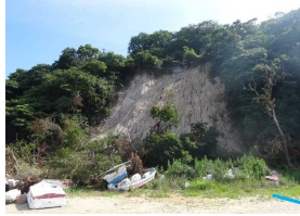
急斜面の崩壊(大浦漁港)