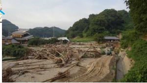
土石流被害(才之原)