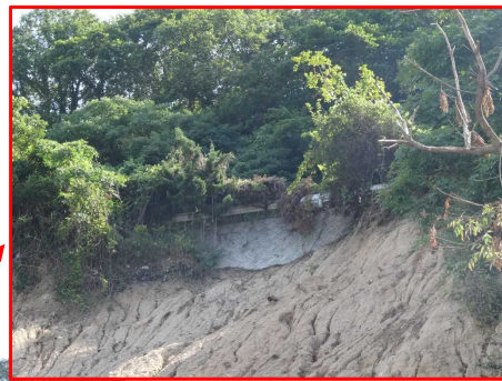
崩壊斜面上部の縁辺(道路部)