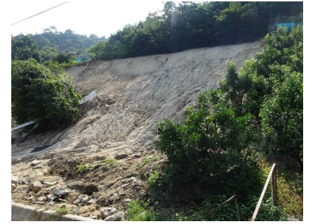
崩壊斜面上部の縁辺(人工的な遷急線; 補修跡)