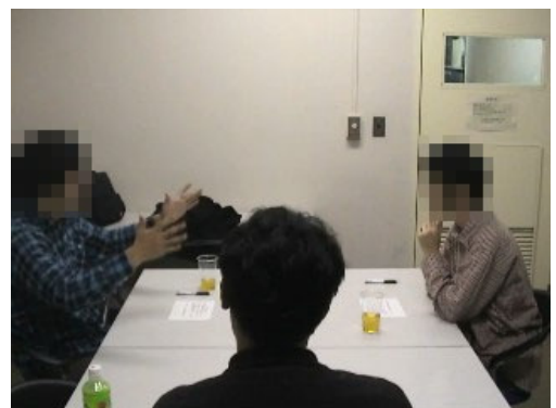
図 話し合いの心理実験の様子

研究のアプローチは、土木計画学、社会心理学、経済学、政治哲学等、社会科学全般を対象とします。興味を持たれた方は、是非気軽に研究室を訪ねてください。